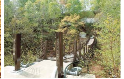
付近に架かる湯ノ沢橋